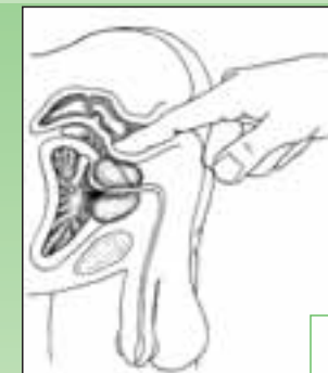
Abtasten der Prostata

Lassen Sie sich ab dem 45. Lebensjahr einmal jährlich untersuchen!